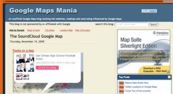
Google Earth blog e Google Maps Mania.