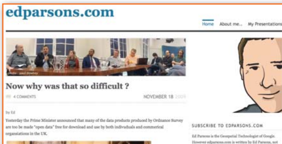
Ed Parson's blog.

Ed Parson's blog ( www.edparsons.com ) è la pagina personale di Ed Parson, Geospatial Technologist di Google. E' possibile leggere e commentare gli aspetti tecnici, le curiosità e le considerazioni personali di uno dei personaggi più influenti nel settore geospaziale e del web mapping. GIS Lounge ( http://gislounge.com ) è uno dei blog ESRI-oriented tra i più seguiti del web. L'aggiornamento continuo su temi quali il GIS e il mapping, un forum e una sezione dedicata alle opportunità di lavoro (principalmente negli Stati Uniti) lo rendono assai completo.