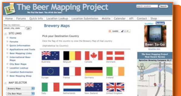
The Beer Mapping Project.