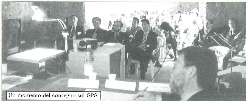
Un momento del convegno sul GPS.